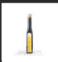
Aceite Virgen de Avellana